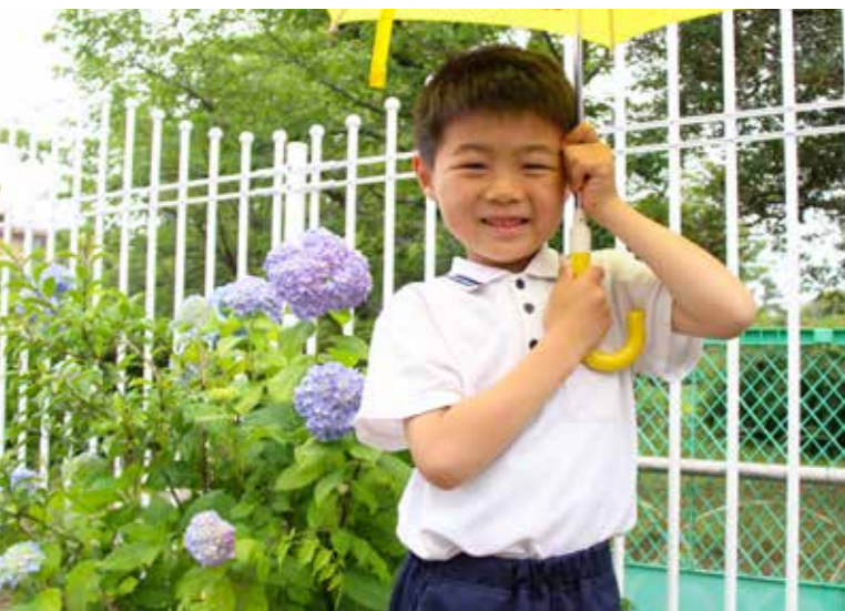
5月31日 風浪宮しらさぎ幼稚園にて