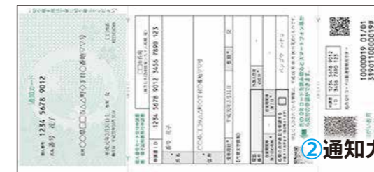
②通知カードなど（世帯人数分。1 通で 8 人まで）