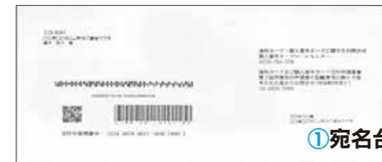
①宛名台紙（問い合わせ先が記載されています）