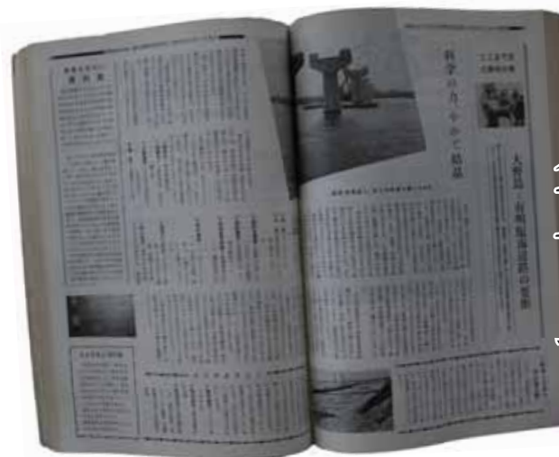
昭和46年12月1日号 「ここまできた新田大橋」

当時は、大川小学校で開催されていました。和洋ダンス類220点、その他140点。22の教室を使用しての展示即売。売り上げは五百万円を突破と掲載されています。