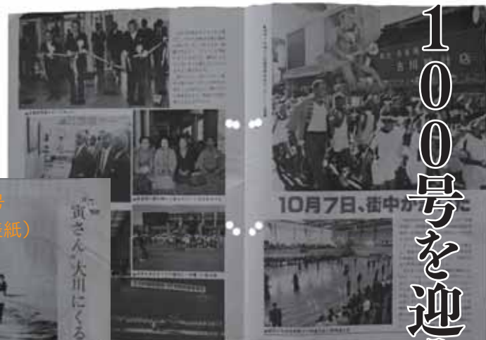
昭和54年11月1日号 「市制施行25周年記念行事」