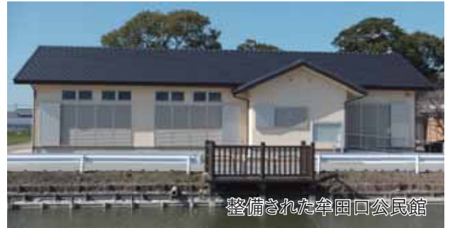
整備された牟田口公民館

公民館の活発な利用で、これまで以上に牟田口町内における住民の世代を超えた親睦と連携を深め、地域コミュニティ活動の活性化が期待されます。