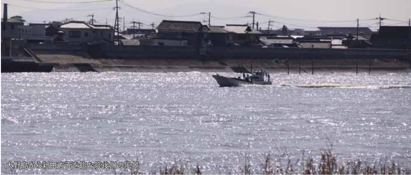
大野島から新田方面を臨む筑後川の風景