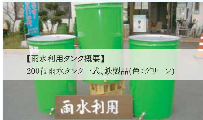
【雨水利用タンク概要】 200ℓ雨水タンク一式、鉄製品(色:グリーン)

リデュース(減らす)・リユース(再利用)・リサイクル(再資源化)の3R推進を進める市では、廃棄物を再利用して雨水を有効利用できるタンクを無償で提供し、利用される人を募集します。