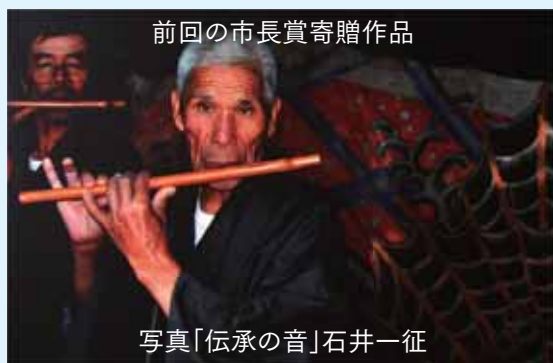
前回の市長賞寄贈作品

【大川市総合美術展】 期間 11月3日(日)～10日(日) 場所 市文化センター