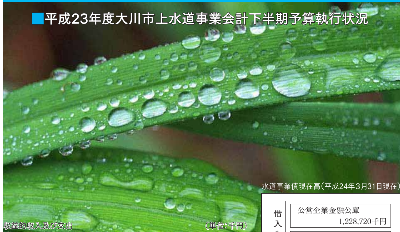
収益的収入及び支出 (単位:千円)