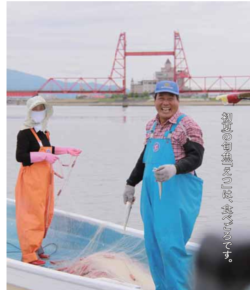
初夏の旬魚「えつ」は、食べごろです。