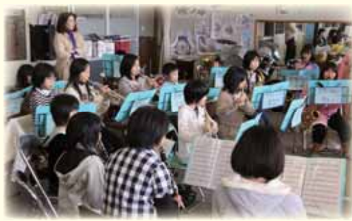
大川児童吹奏楽団の練習風景

音楽のまちづくり 本市は、みなさんご承知のように昭和の大作曲家、古賀政男先生に代表される音楽に大変、縁のあるまちです。また、本市出身の歌手、大川栄策氏や最近では、大川市在住の实在人物を主人公にした「のだめカンタービレ」などは、音楽の世界と大川を改めて結びつける大きなキッカケとなりました。 市では、市内小中学校に多くの楽器等を配備し、音楽にかかわりを持つキッカケづくりを促進しています。さらに、「古賀政男記念音楽祭」「音楽村まつり」など音楽をテーマにしたイベントも多く開催されています。みなさんも音楽に触れ、大川の魅力を再認識してみませんか。