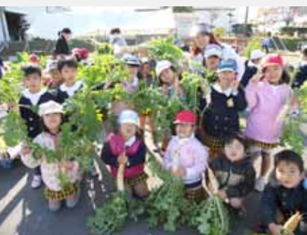
清力保育園の園児たち

日時 ①2月9日(水)②23日(水) いずれも13時30分～14時30分 場所 市清掃センター2階 内容 ①導入講座(コンポスト