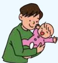
男性が育児休業や介護休業をとることについて

一方で、「休業補償が十分ではないので、とらなくても仕方がない」(14・2%)と「職場環境を考えるととらなくても仕方がない」(18・6%)で、3割を超えており、職場の現状などを反映して消極的な捉え方をしている人もいます。