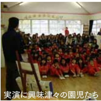
実演に興味津々の園児たち