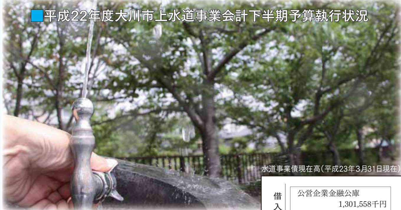
水道事業債現在高(平成23年3月31日現在)