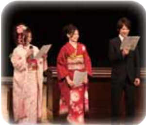
昨年の式進行の様

話で申込みください。 申込期限 9月8日(木) ☎ 市教育委員会生涯学習課 85-5618 FAX 86-8479 831-8601 大字酒見二五六一 Eメール okwshougai@city.okawa.lg.jp ●外地の集結地において、総領事館、日本人自治会などに預けた通貨・証券などのうち、その後日本に返還されたもの 預かった通貨などの半数以上は返還の申し出がなく、現在も税関に保管されたままになっています。 ※返還については、本人だけでなく、家族も請求することができ、気軽に税関へ問合せください。 ☎ 長崎税関監視部統括監視官 0120-828-680