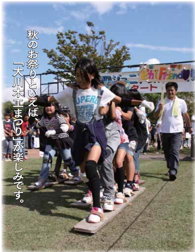
秋のお祭りといえば、「大川木工まつり」が楽しみです。